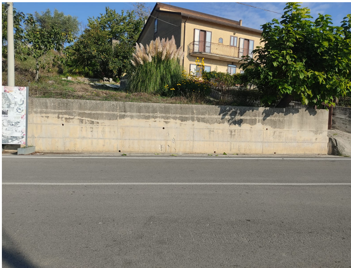
Foto 2 -Vista frontale