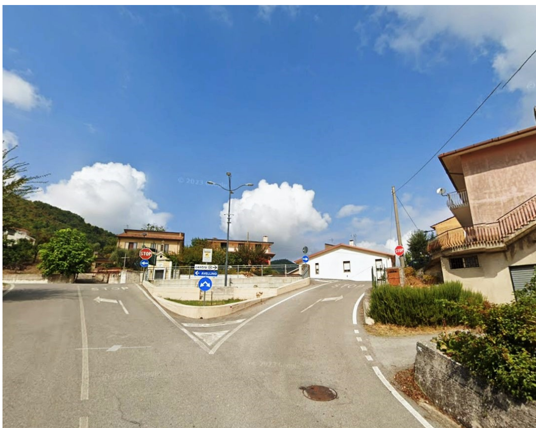
Foto 6 -Foto del contesto