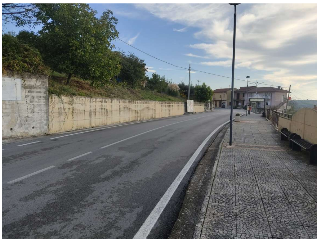
Foto 4 -Vista di scorcio